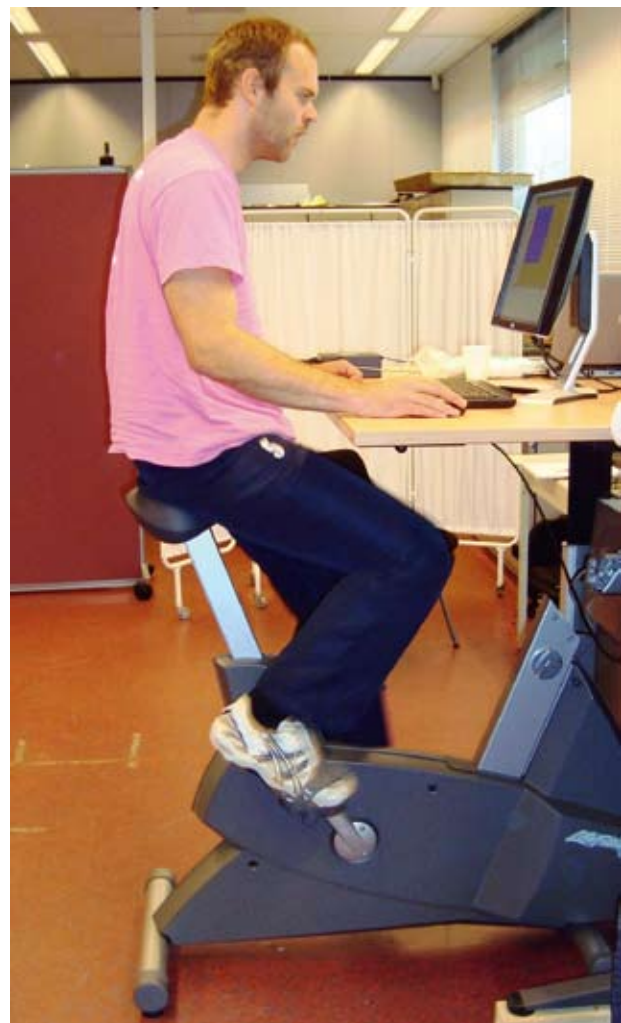
Figuur 1. Experimentele opstelling met beeldscherm, toetsenbord en muis op een verhoogde tafel. Links is de conditie steppen zichtbaar, rechts de conditie fietsen